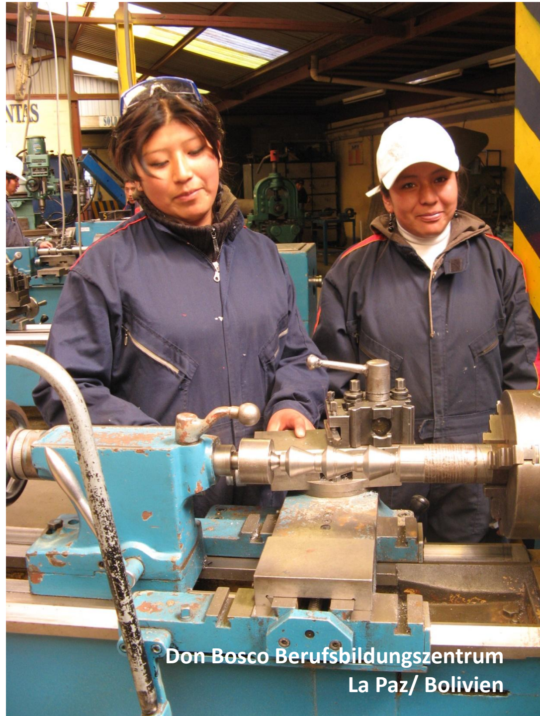
Don Bosco Berufsbildungszentrum La Paz/ Bolivien

Wir helfen Ihnen, auch für Ihr Unternehmen eine passgenaue CSR- Strategie zu entwickeln und Ihr Partnerprojekt zu finden.