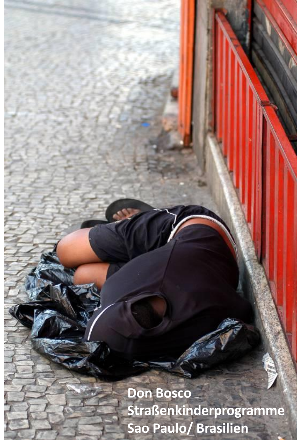
Don Bosco Straßenkinderprogramme Sao Paulo/ Brasilien

Don Bosco Jugend Dritte Welt e.V. setzt sich in Zusammenarbeit mit den Salesianern Don Boscos für ausgegrenzte und benachteiligte Kinder und Jugendliche ein.